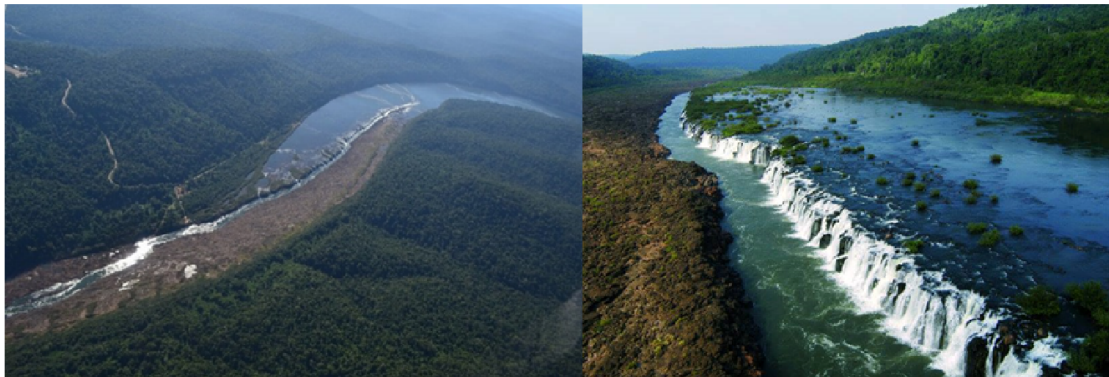
Figura 1 – Imagem aérea do Parque Estadual do Turvo e do Salto do Yucumã (2015).

e atividades de lazer, que acabam contribuindo para a preservação deste patrimônio natural do estado (PLANO DE MANEJO DO PARQUE ESTADUAL DO TURVO, 2005).